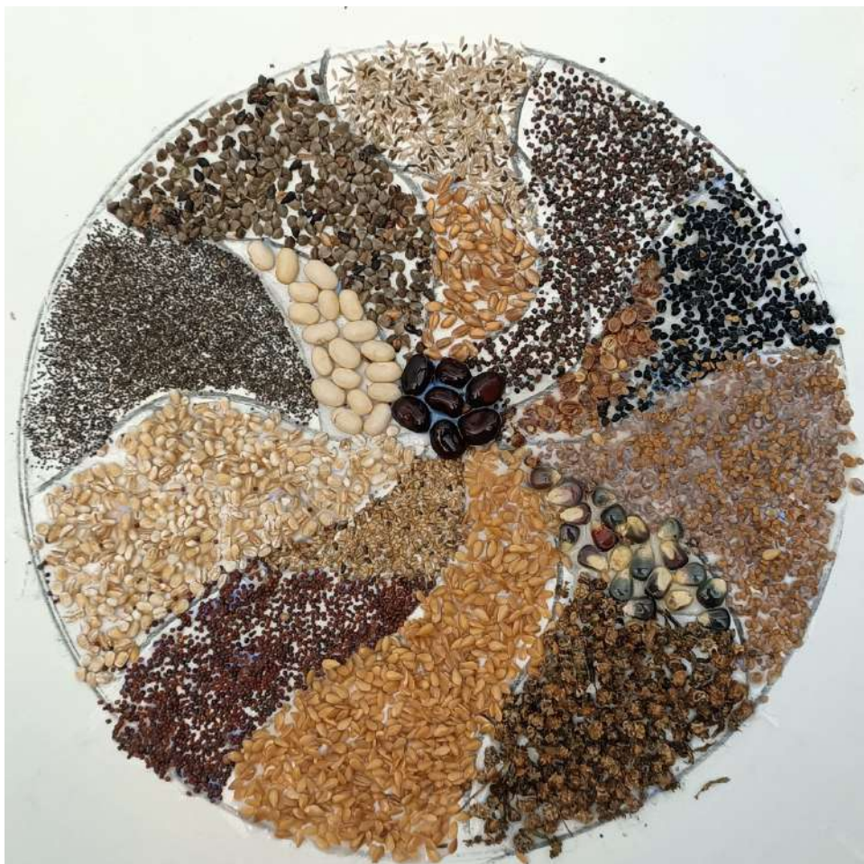
Figure 23 : Mandala de graines (essai de Éliane).