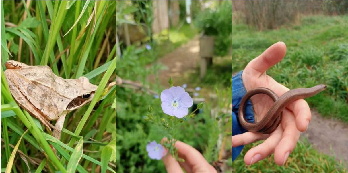
Figure 2 : Grenouille Agile, Lin Bleu et Orvet.

reprises. A partir de début juin, ce sont des bébés crapaud que nous avons le plaisir de croiser çà et là dans les allées.