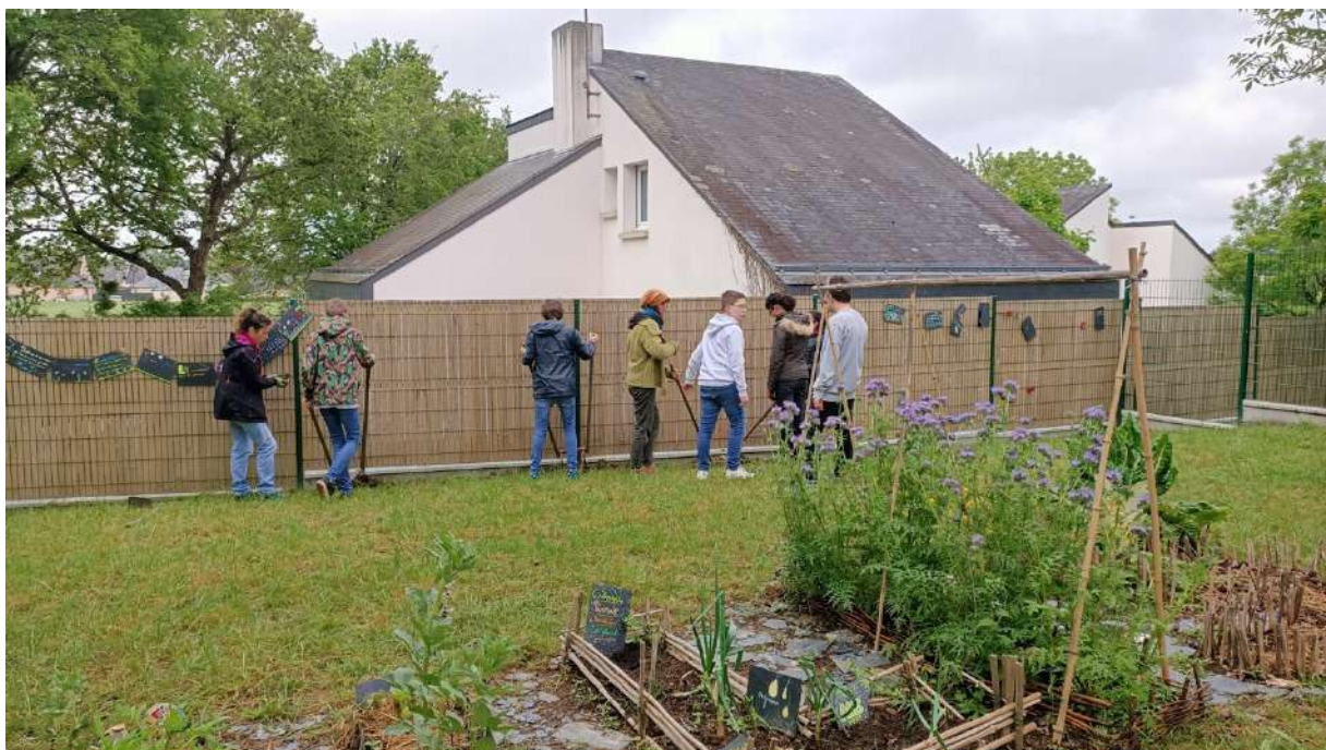
Figure 19 : Création d'une plate-bande avec bordure en osier.