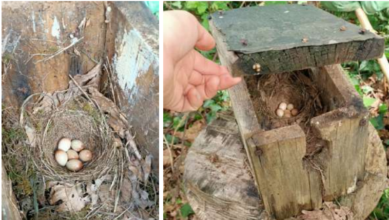
Figure 1: Nid de rouge gorge dans le nichoir, avec 6 œufs

L'espèce endémique (Tap'Logoden) reste bien installée.