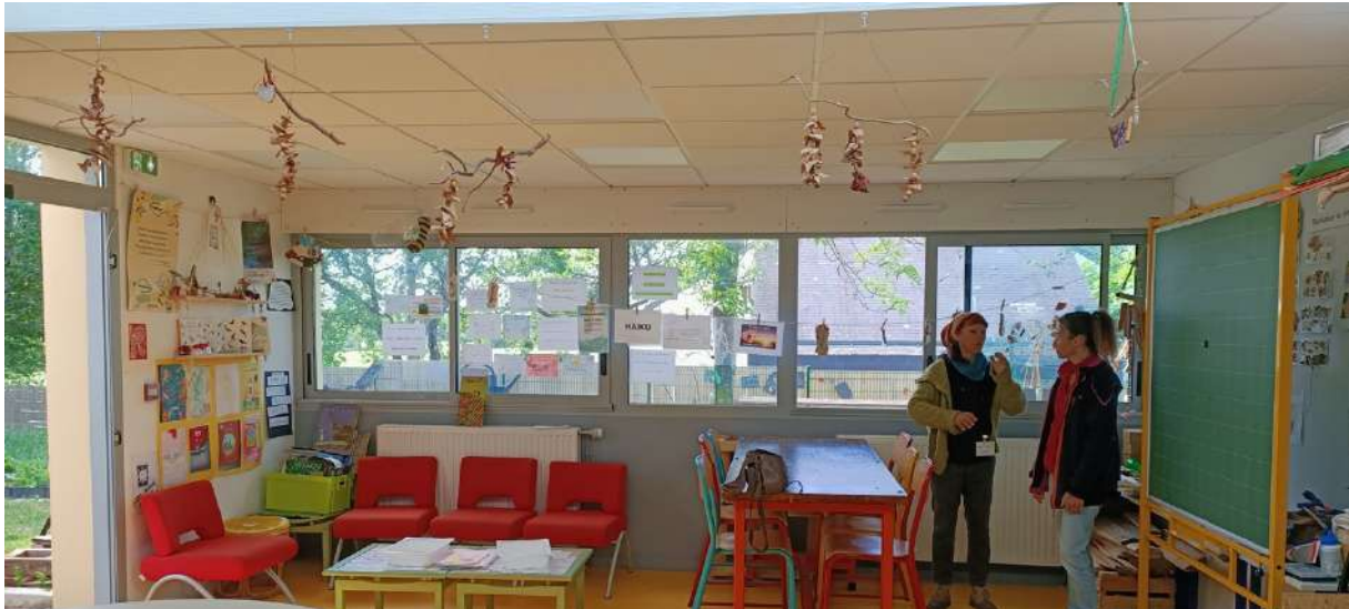
Figure 16 : Dans le fond de la salle, une porte et plusieurs fenêtres donnent sur le jardin de la classe. Aux murs, différents travaux en lien avec le jardin.

Nous poursuivons l'aménagement du jardin de la classe ULIS.