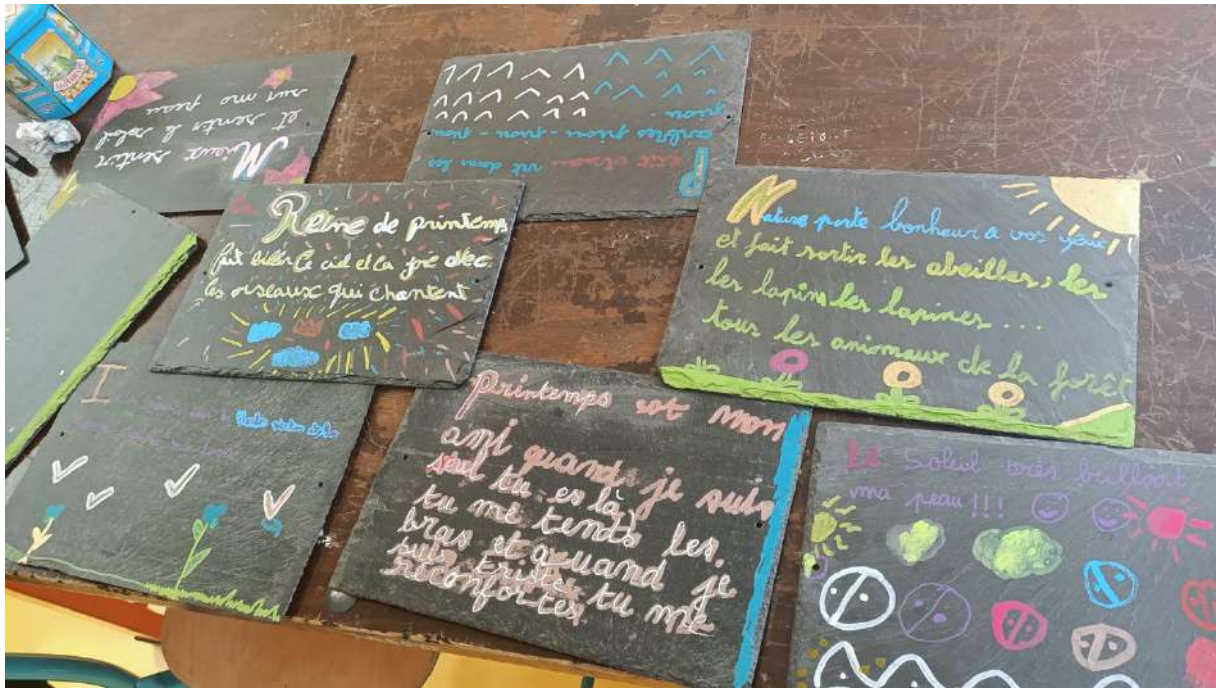
Figure 18 : Poèmes printaniers de la classe ULIS. Notamment : "Reine de Printemps fait briller le ciel et la joie avec les oiseaux qui chantent". "Printemps est mon ami - Quand je suis seul tu es là, tu me tends les bras, et quand suis triste tu me réconfortes".