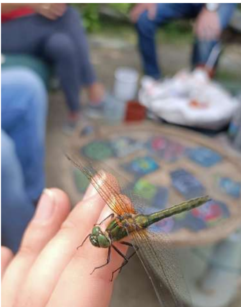
Figure 3 : Libellule

Le 19 mai, l'atelier « Jardin Pour Tous » a pu admirer en fin de séance une magnifique Libellule, attrapée par Éliane dans une serre où elle était restée coincée.