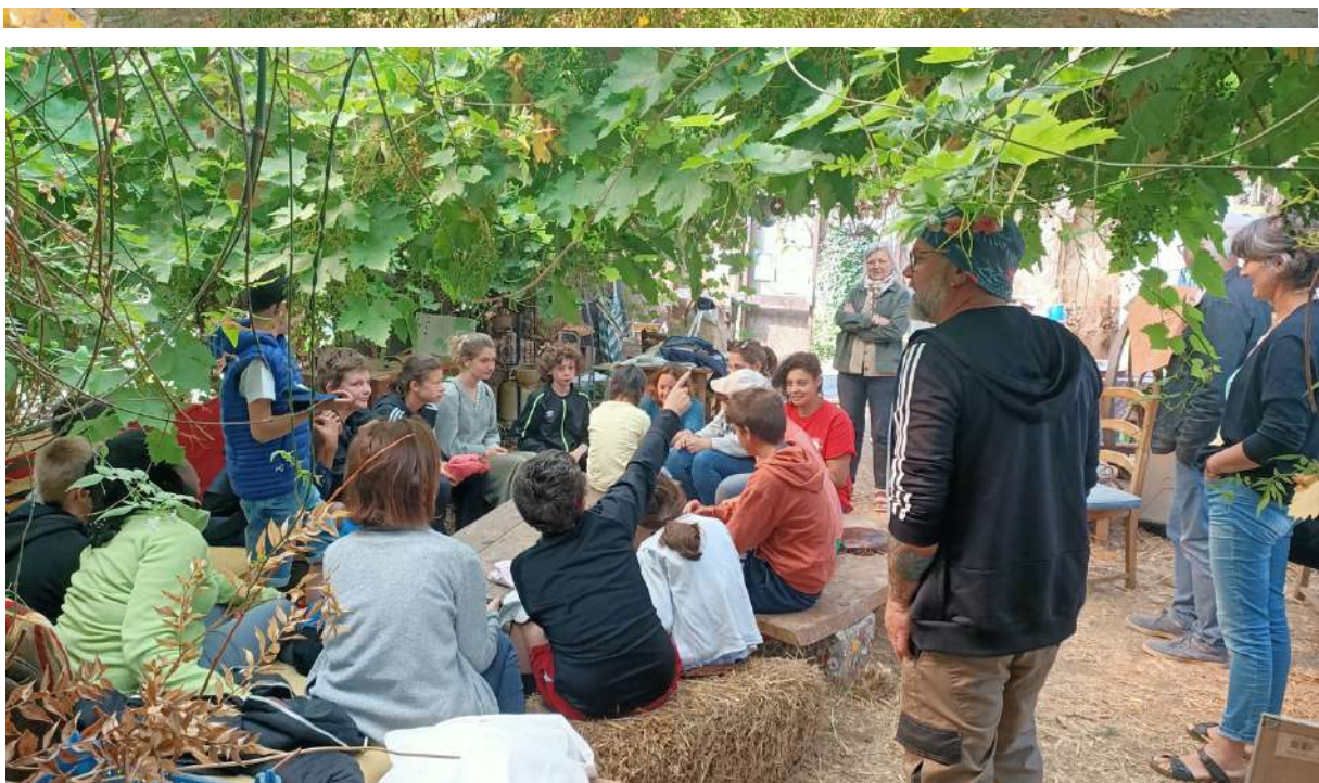
Figure 14 : Accueil dans la serre, sous la vigne qui est bien chargée cette année.