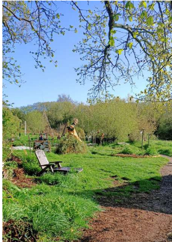
Figure 6 : A gauche, les fleurs de pommier au-dessus du jardin des aromatiques.

A droite, le jardin près du bureau sous le soleil matinal, avec la chaise longue ... Que personne n'a le temps d'utiliser !