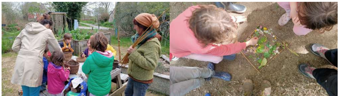
Figure 15 : Chasse aux œufs et Land Art.

Ils et elles préparent leur fête, qui aura lieu le dernier mercredi de juin, et à laquelle tous les parents sont invité(e)s. On ne vous en dit pas plus, c'est une surprise !